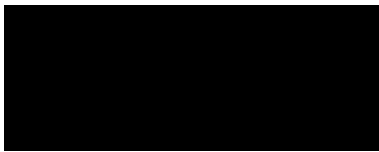
Joanna Kurth museopalvelujohtaja

Jos maata kaivettaessa tai muuta tehtäessä löydetään merkkejä kiinteistä muinaisjäännöksistä tai irtaimia muinaisesineitä, on muinaismuistolain 14§:n ja 16§:n mukaan työ heti keskeytettävä ja asiasta ilmoitettava viipymättä museoviranomaiselle.